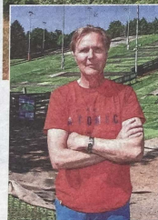
De pistes van Wolfskamer Wintersport (Gooische Alpen) worden vernieuwd. Links boven: Coronel Sports.

aan een stalen kabel. We maken steeds vakken van tien meter. Zo zorgen we ervoor dat de matten nog kunnen werken. Als het erg heet is, zoals nu, zetten de matten uit. Als het koud is krimpen ze juist. Die ruimte moet er zijn, zonder dat de skiër daar last van heeft. Het luistert heel nauw.“